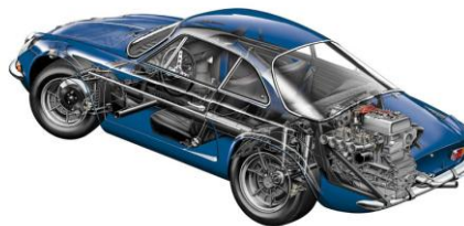
1972 ALPINE A110 1600S