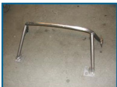
Arceau Club ALPINE A110. Réf. ALA110ARC1K.