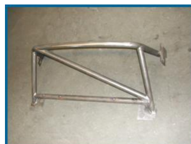
Arceau Club SPORT ALPINE A110 Réf. ALA110ARC3K.